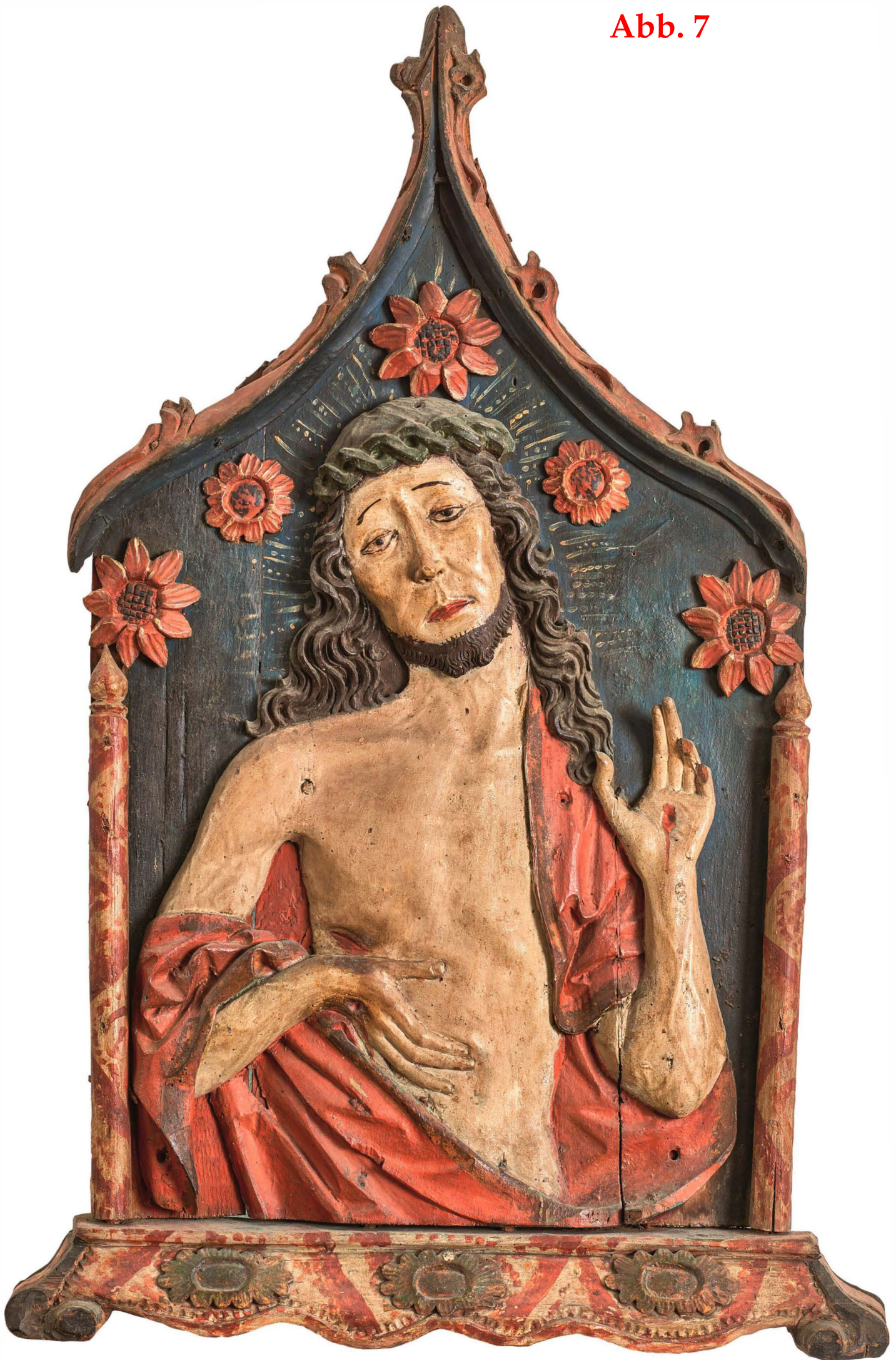
um 1500 (Erbärnde-Christus, süddeutsch)