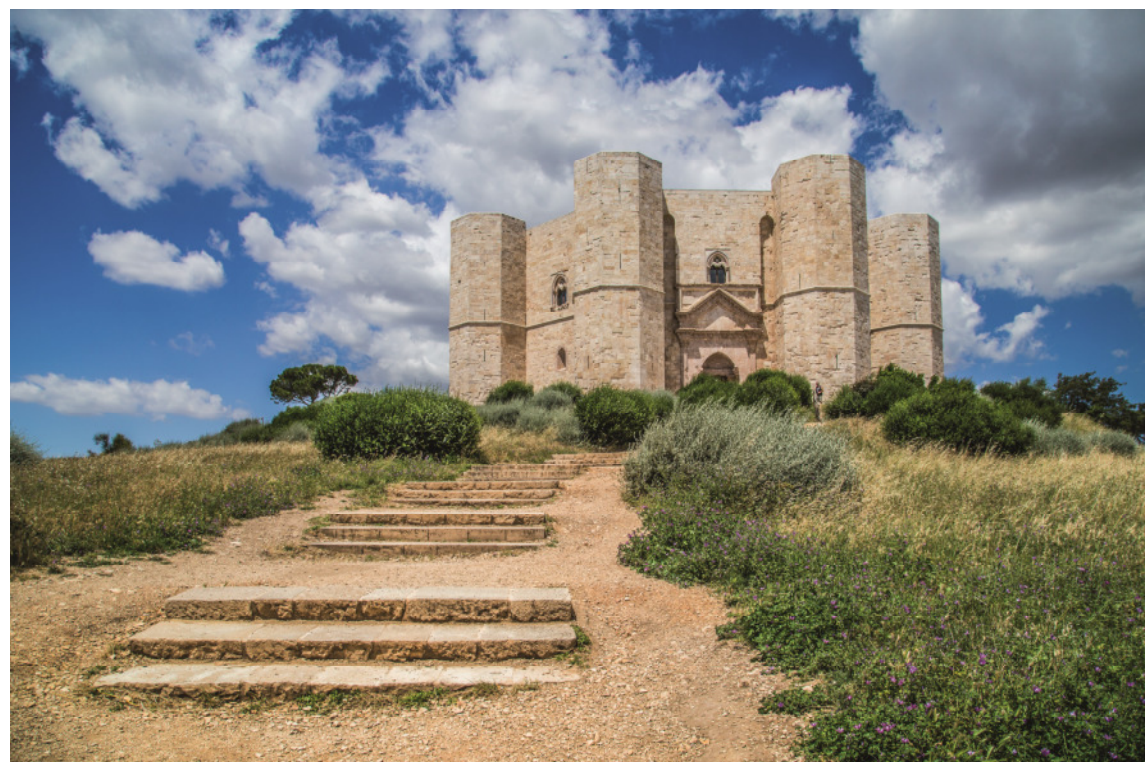
Castel del Monte

Die beigefügten Allgemeinen Reisebedingungen sind Bestandteil dieses Prospektes.