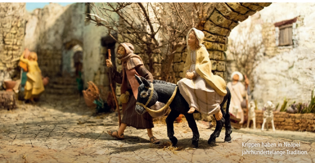
Krippen haben in Neapel jahrhundertlange Tradition.

Glaube, Kunst und Kultur in Süditalien: Funkelnde Kirchenkuppeln, originelle Weihnachtskrippen und gelebte Volksfrömmigkeit prägen die Adventszeit in Süditalien und geben unserer Reise eine besondere Faszination! Glanzlichter: ✨ Krippenstraße Via S. Gregorio Armeno in Neapel ✨ Pompeji ✨ Krippenausstellung in der Via della Conciliazione, Rom