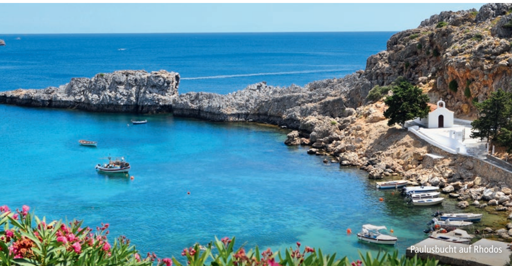
Paulusbucht auf Rhodos

Wir folgen dem Apostel Paulus auf seiner Missionsreise nach Rhodos und entdecken die heilige Insel Patmos, die als Schöpfungsort der Offenbarung des Evangelisten Johannes gilt. Die Insel Samos umarmt uns mit griechischer Lebensfreude. Glanzlichter: ☆ Lindos mit Paulusbucht ☆ Johanneskloster auf Patmos ☆ Kloster Timiou Stavrou