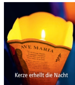
Kerze erhellt die Nacht