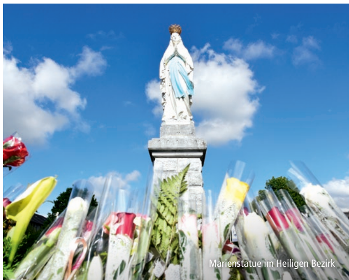
Marienstatue im Heiligen Bezirk

Die Verehrung Mariens ist ein wichtiger Bestandteil im religiösen Leben in Frankreich. Aus diesem Grund kommt dem Gedenken an die Himmelfahrt Mariens in Lourdes eine besondere Bedeutung zu. Es gibt viele Marienfeste im katholischen Kirchenjahr, doch wohl keines ist in der Tradition und im Glauben der Menschen so verankert wie das Hochfest Mariä Himmelfahrt. Natürlich ist dieser Tag auch in Lourdes einer der Höhepunkte des Jahres. Feiern und erleben Sie ihn mit uns bei der Muttergottes von Lourdes!