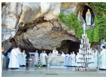
An der Grotte

(Empfangene Botschaft der hl. Bernadette)