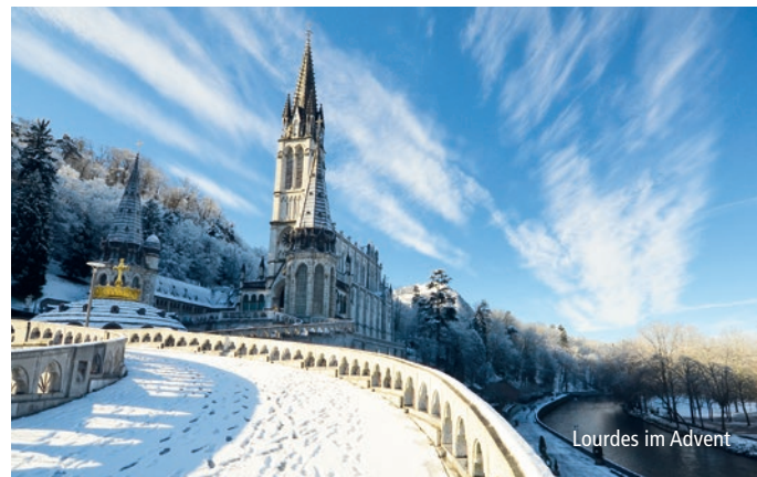
Lourdes im Advent

Erleben Sie mit uns die adventliche Zeit des Wartens und der Vorbereitung auf Weihnachten in Lourdes. Der Festtag „Mariä Empfängnis“ am 8. Dezember ist einer der Höhepunkte der Reise. Am Vorabend zu diesem besonderen Fest erleuchten wir bei der eindrucksvollen Lichterprozession mit unseren Kerzen das Dunkel der Nacht.