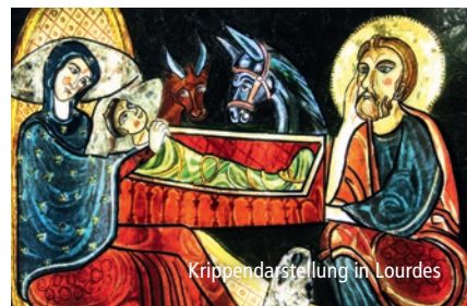
Krippendarstellung in Lourdes