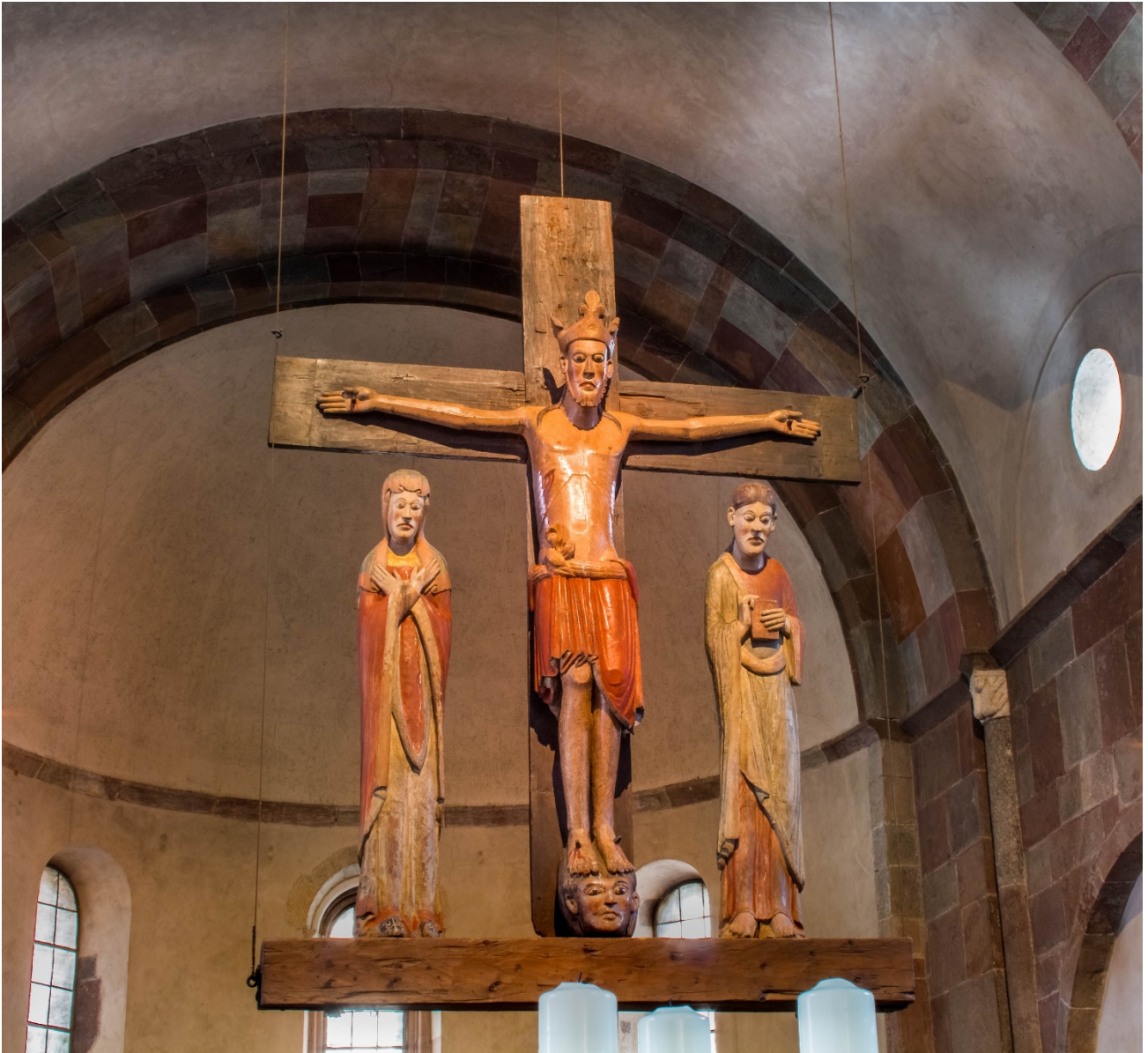
12. Jh (Pustertal-Stiftskirche Innichen)