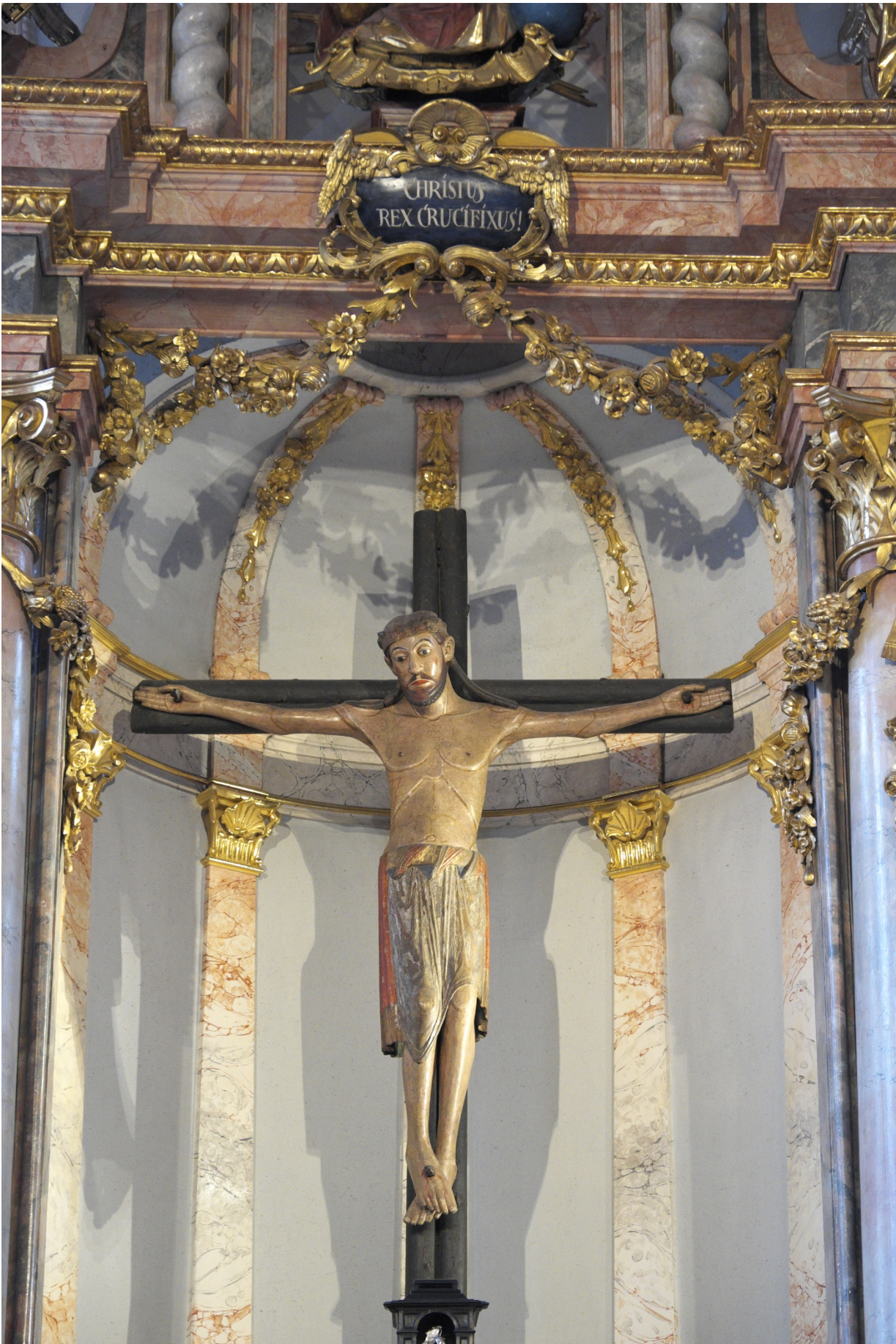
etwa um 1170 (Forstenried-Heilig Kreuz)