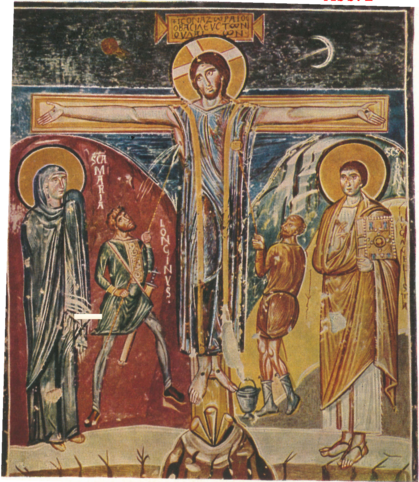
8. Jh (Rom-Santa Maria Antiqua)