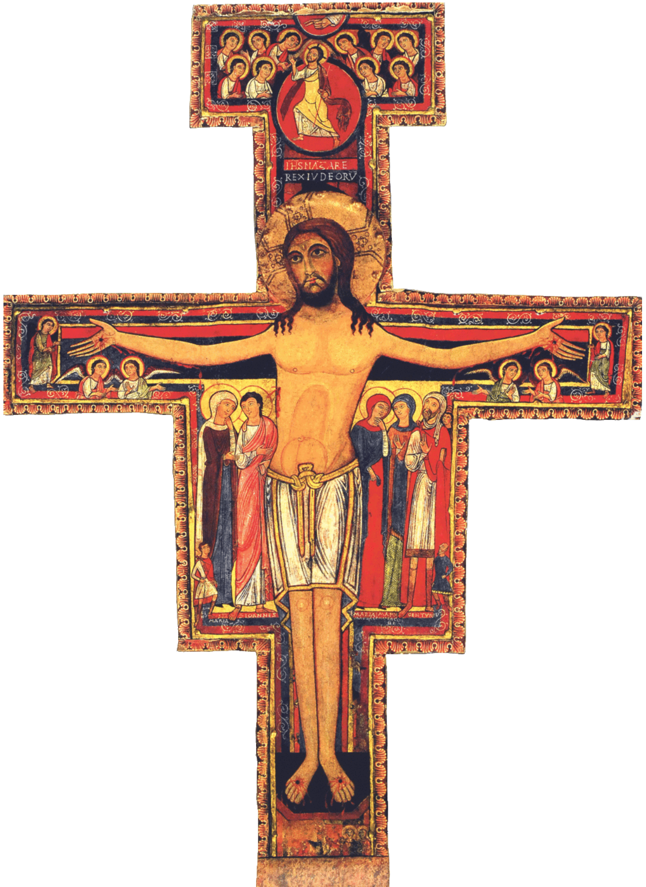
12. Jh (Kreuz von San Damiano)