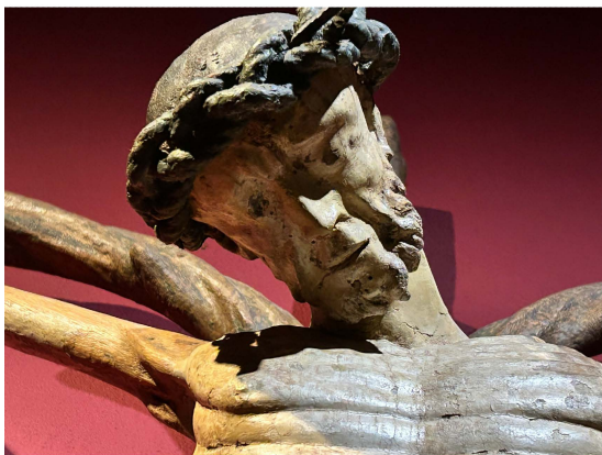
Mitte 14. Jh.(Münster - Astkreuz LWL Landesmuseum für Kunst und Kultur)