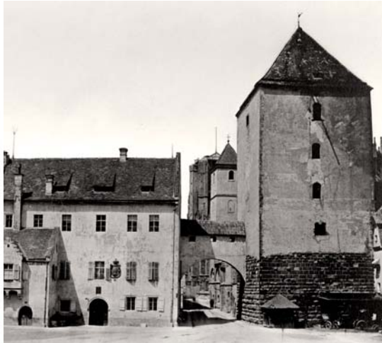
Alter Kornmarkt, 1861

Informationen zu den Standorten finden Sie unter www.bistumsmuseen-regensburg.de und in einem gesonderten Informationsflyer.